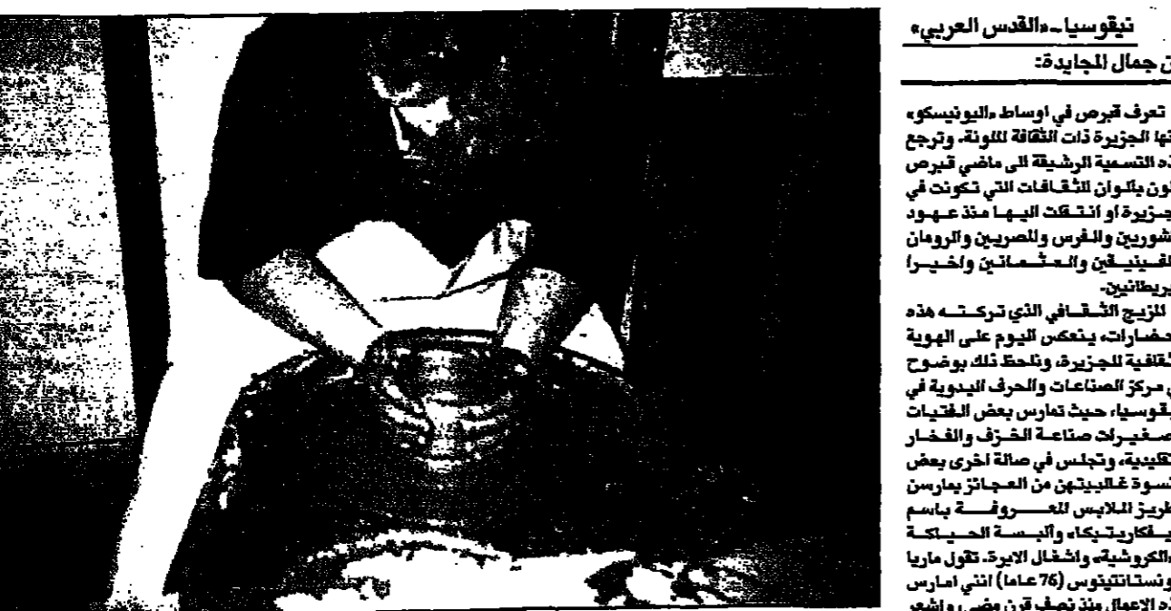
سيدة قبرصية تعمل من طين الاحمر تحفا فخارية

المصر وتعتبر قبرصا وتمازس، ويصنع وهو عبارة عن تشكيل على طين الاحمر، وتحويلها الى تحف فخارية ملونة، تلكها لا تخشى على يدك من هذا الصنعة.